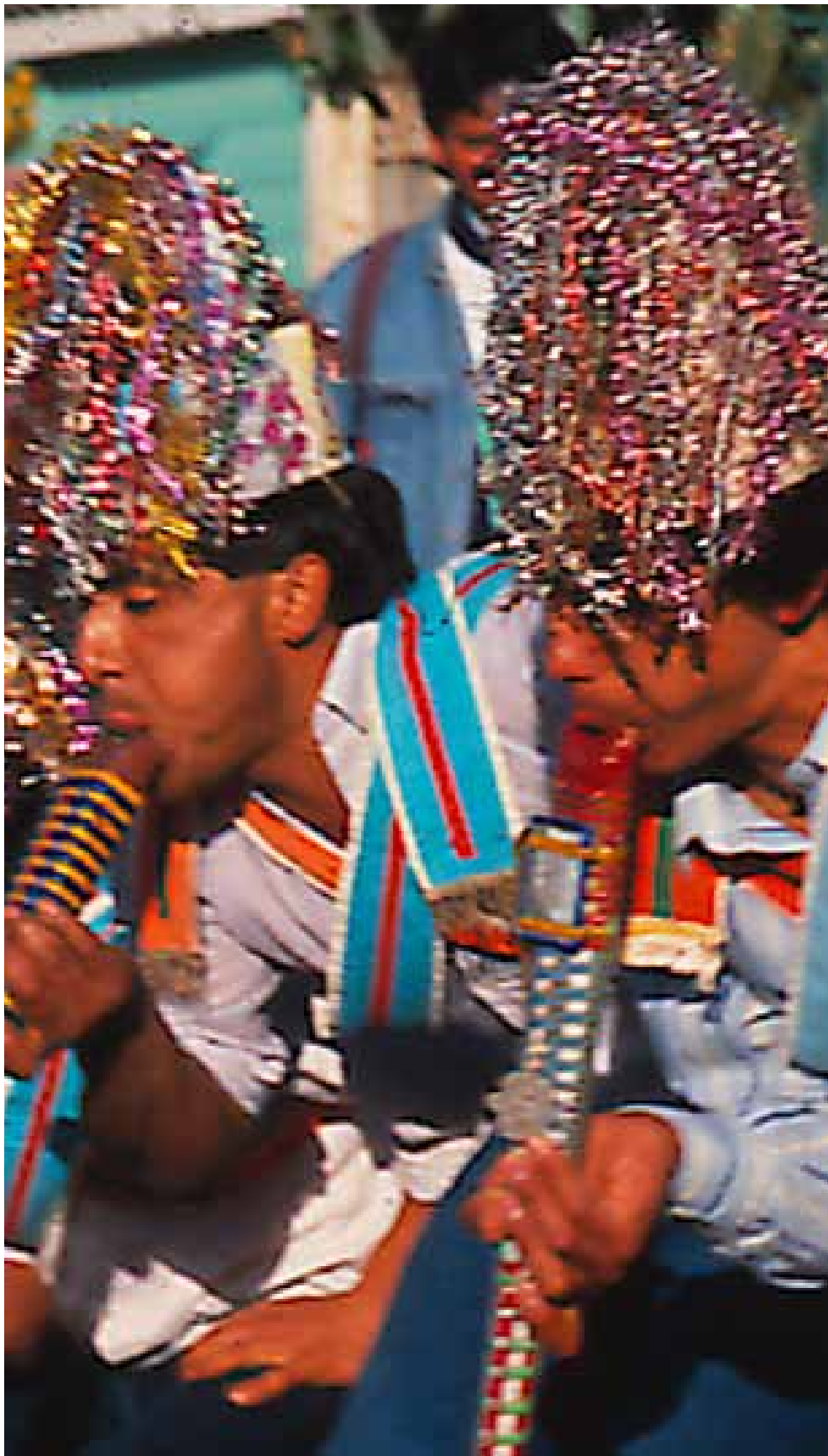
Fotografía: Claudio Mercado, Chineando en el Aconcagua, 1994.